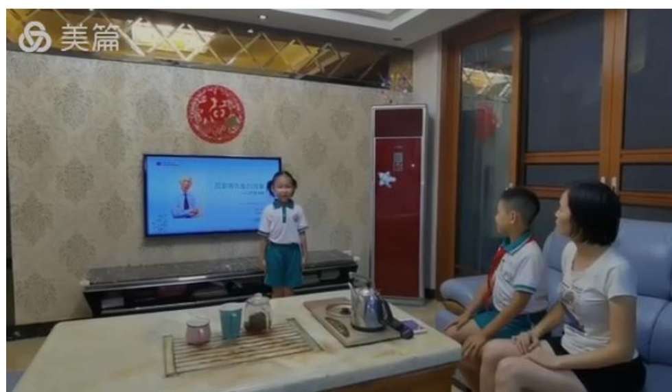
在家里，我给家里人讲田爷爷的故事。