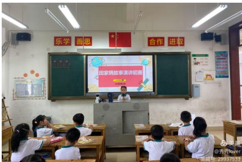
在班里，我给同学们讲田爷爷的故事。

在家里，我给家人讲；在学校，我给同学们讲。从每一个故事，我们看到田爷爷身上那些如星星闪耀的精神，是我们学习和传承的力量。