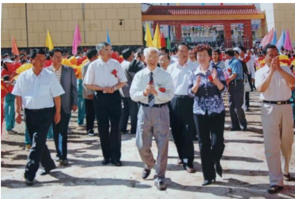
田家炳先生亲临我校参加基金会捐建教学楼落成典礼

教学一体机；2020年捐资48.23万元，新建了一座高标准的录播教室；2021年，捐资35万元新建物理、化学、生物三个实验室，极大的改善了我校的办学条件。2018年至今，每年捐助2万元田家炳基金会优秀学生助学金，资助家境贫寒、品学兼优的学子，帮助他们实现成人成才的求学梦想。多年来，我校教师参加基金会主办的校长能力提升班、班主任论坛、骨干教师培训班、田家炳年会等培训350人次以上；极大提升了我校教师教育教学的能力。