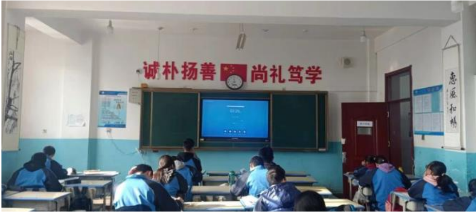
田家炳基金会捐赠的触摸一体机