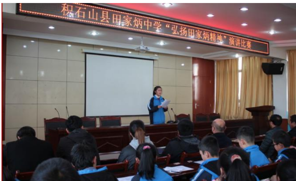
“弘扬田家炳精神”演讲比赛