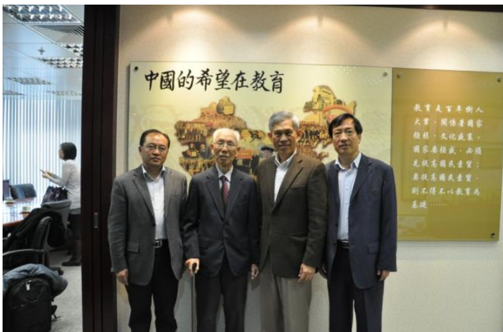
原县教育局局长董汛和原我校校长樊永明赴香港看望田家炳先生