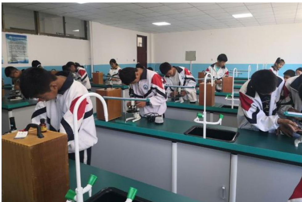
田家炳基金会捐建的生物实验室