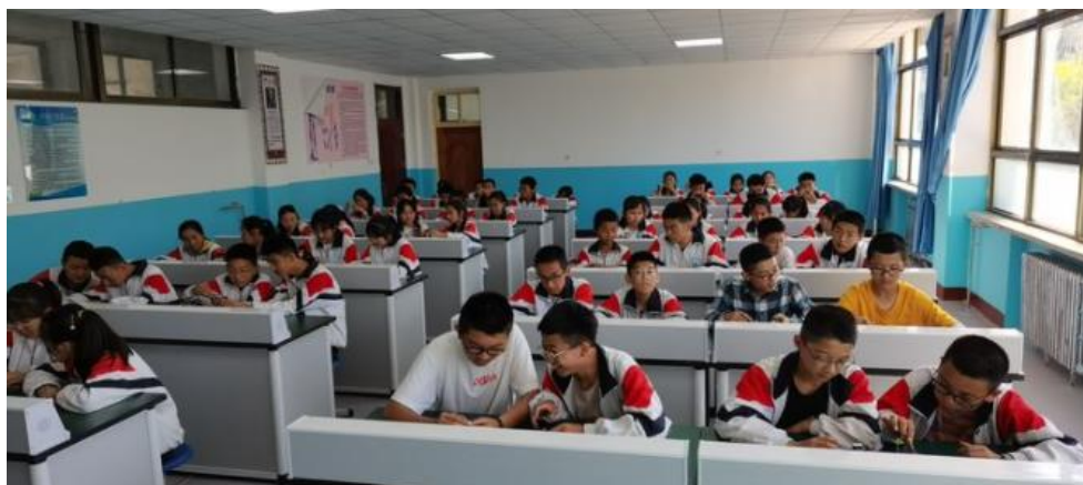
田家炳基金会捐建的物理实验室