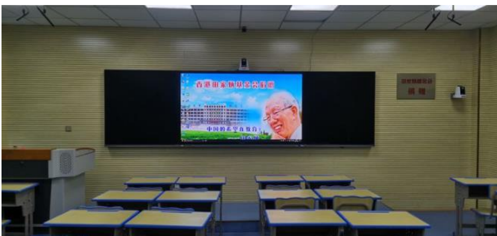
田家炳基金会捐建的录播室