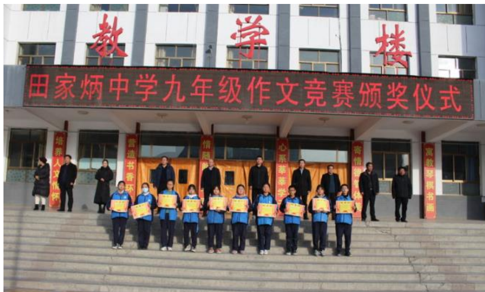
“弘扬家炳精神，传承中华美德” 作文竞赛