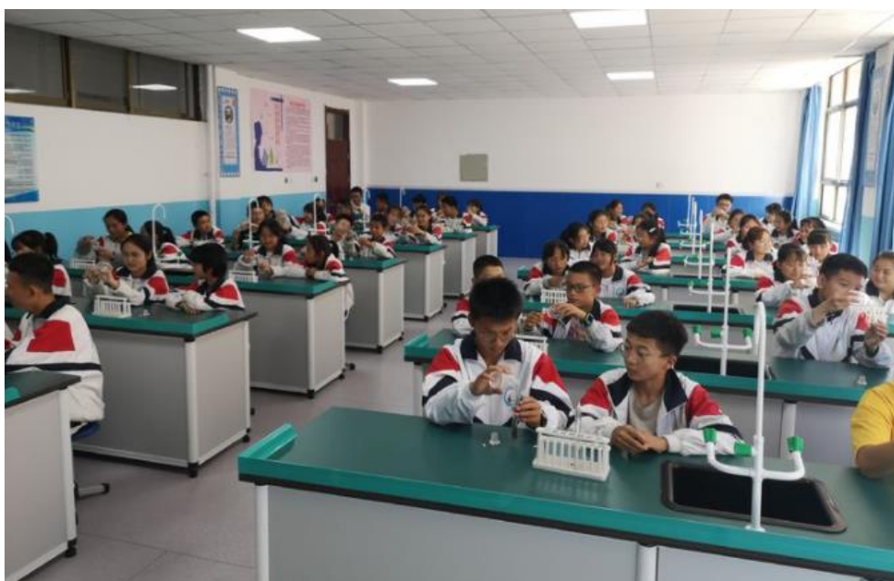
田家炳基金会捐建的化学实验室