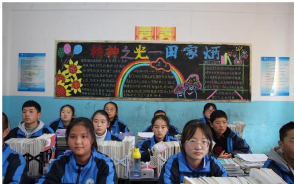
“弘扬田家炳精神”黑板报