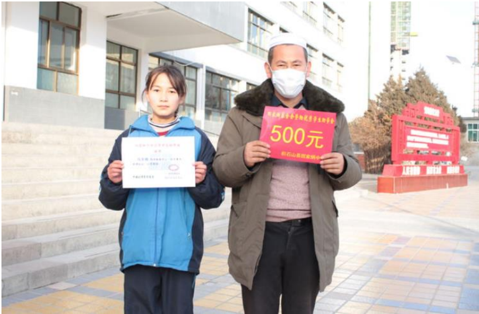
田家炳基金会优秀学生资助金发放仪式