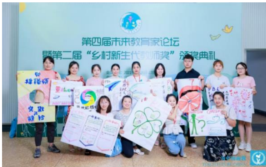
2021年第四届论坛，参会老师自主策划开闭幕，并担任坛主组织同伴交流△

论坛从为中国而教“项目教师的论坛”，发展成为“中国乡村教师的论坛”；从项目教师内部的“小灶”，成为了各地乡村青年教师联合起来，同寻求美好教育的“驿站”。“我做了那么多改变，是为了心中不变”——不变的，是每一届参会老师青春如火的热情，带给我们扑面而来的乡村教育生命力，以及他们“寻志同道合伙伴”渴望的声音，这些也一直勉励我们前行。