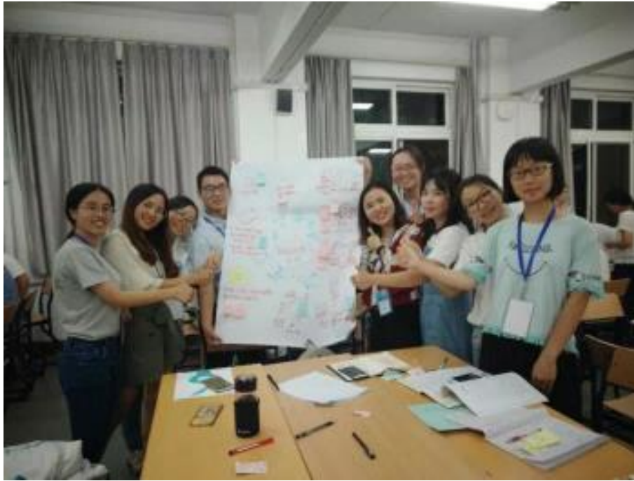
2018年第三届论坛，参会老师小组参与式探讨教育问题△