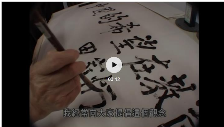
田家炳基金会远程致辞视频

谨以此文，感谢田家炳基金会与众多同行者对为中国而教和乡村青年教师的大力支持；感谢中国青年报，人民政协报，中国教师报，《未来教育家》期刊历年对论坛予以报道，为乡村青年教师振臂高呼。也借此文，向关注为中国而教的乡村青年教师承诺：培养促进教育公平的领导者，我们始终初心不改，我们相信，去到乡村的你们，是“未来教育家”！