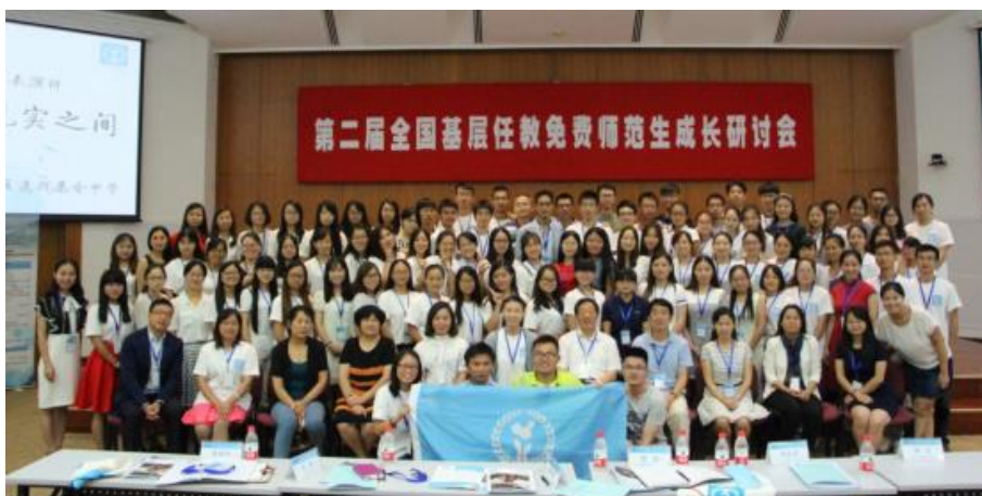
2016 年第二届论坛在北京师范大学开展△

2014 年的首届论坛和 2016 年的第二届论坛，因为有限的影响力，以为中国而教未来教育家项目老师和校友为主，规模在 80 人左右。首届论坛在陕西师范大学召开，彼时的项目老师是毕业于六所部属师范高校而选择回到县城的公费师范生，以在县城高中任教为主。第二届论坛在北京师范大学举办，参会老师 90 人左右，仍以为中国而教的项目老师为主，其中有大约 1/3 是为中国而教未来教育家项目校友。