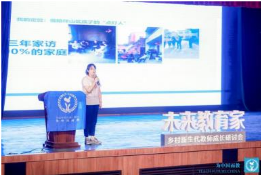
2021年第四届论坛，新生代获奖教师向与会教师分享乡村教育探索△